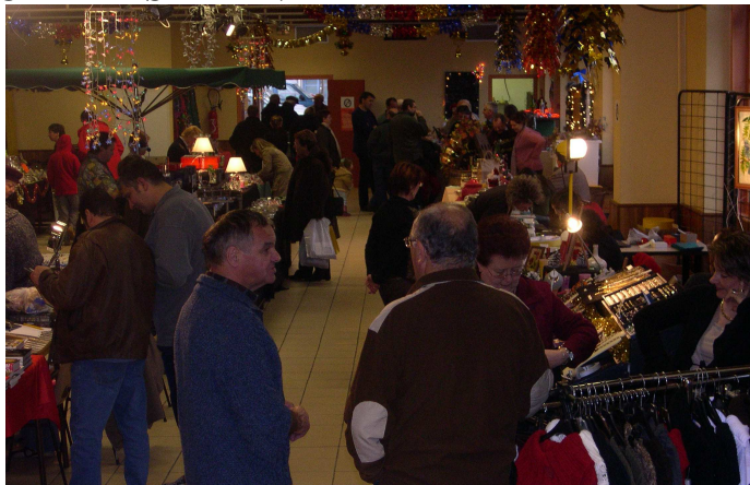
Réussite pour le marché de Noël qui s'est déroulé samedi 16 et dimanche 17 décembre 2006