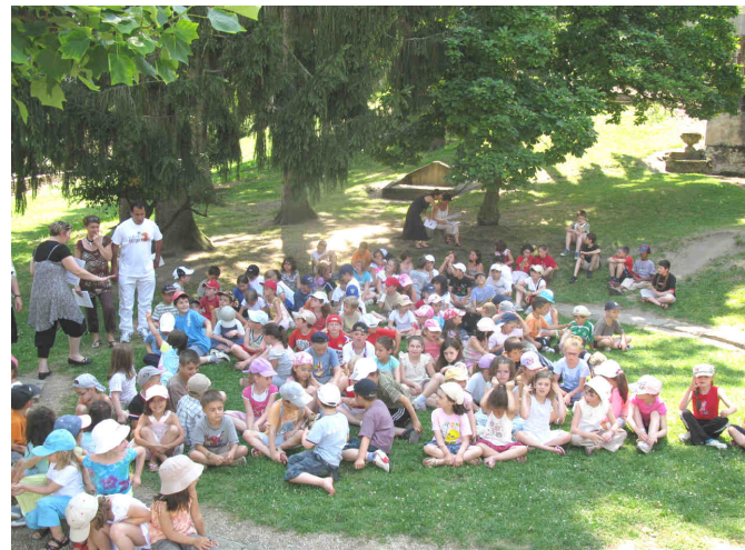
Cross École Saint-Pierre