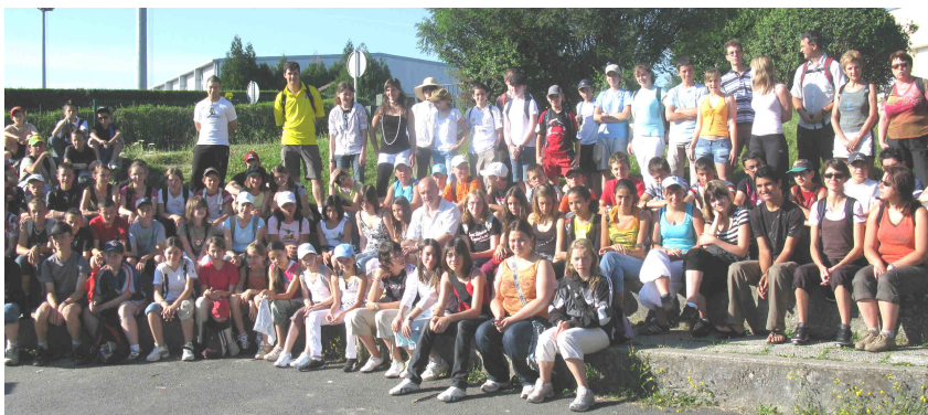
Randonnée Collège de Bellime