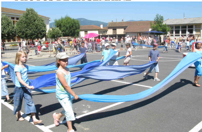
Fête des écoles