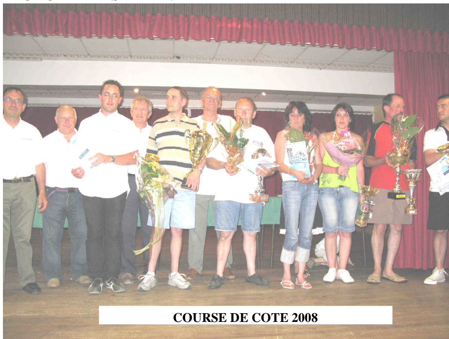
COURSE DE COTE 2008