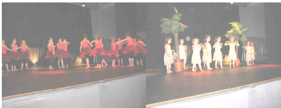
ASSOCIATION PAS A PAS : SPECTACLE DU SAMEDI 21 JUIN