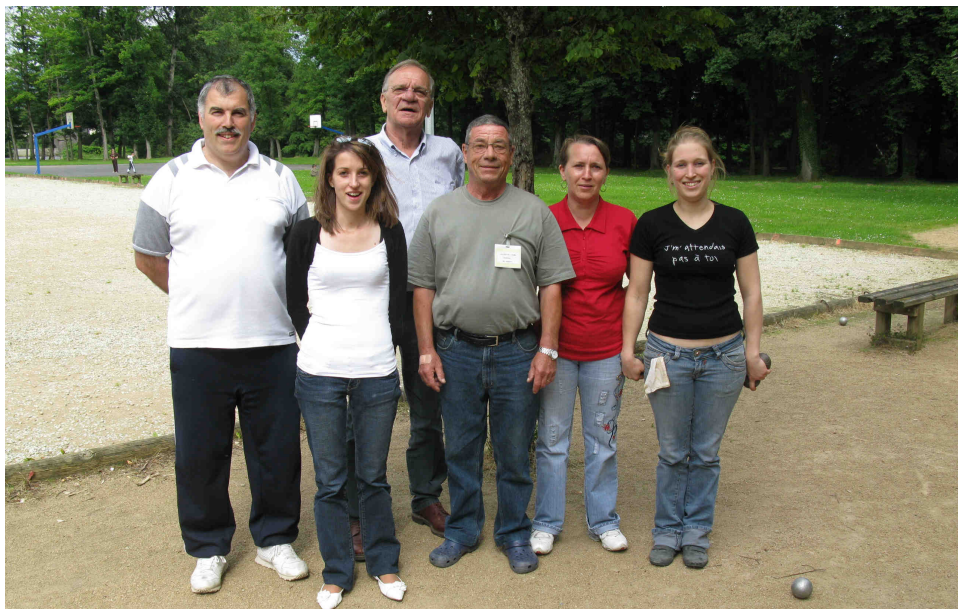
Au parc Lasdonnas : concours de pétanque des Aînés de la Dore. Le Maire a encouragé les participants.